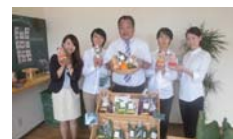
株式会社ワダゲン