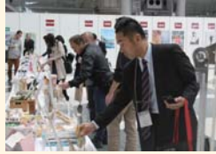
昨年は157商品を展示