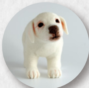
自分の目で見ると