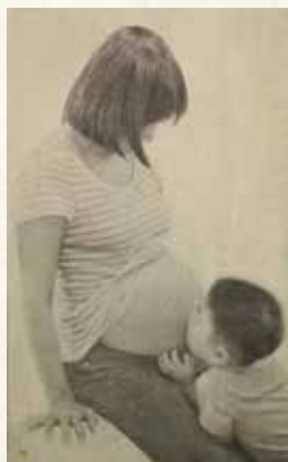
「微笑みがえし」530×333mm 紙本水墨 2015年