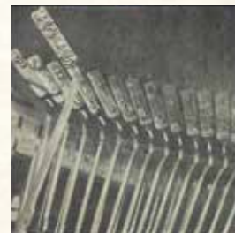
「still life series #02 -typewriter-」 273×273mm 紙本水墨 2015年