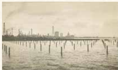
「家路」242×410mm 紙本水墨 2016年