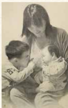
「with smiles」530×333mm 紙本水墨 2015年