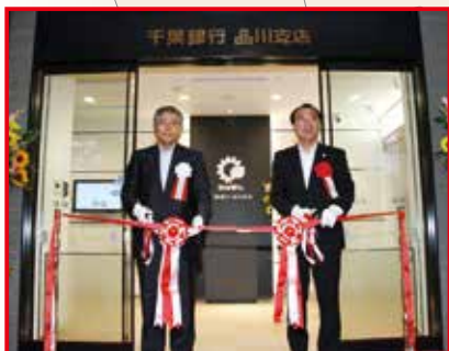
品川支店 平成27年7月

「品川法人営業所」の業務を承継・拡大し、法人のお客さまだけでなく、個人のお客さまのローンや資産運用のご相談にも対応してまいります。