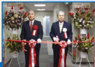
ちばぎん証券 柏支店 平成26年10月