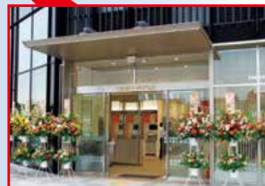
成田支店 平成26年8月

「品川法人営業所」の業務を承継・拡大し、法人のお客さまだけでなく、個人のお客さまのローンや資産運用のご相談にも対応してまいります。