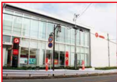
矢切支店 平成26年7月