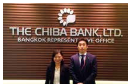
バンコク駐在員事務所 平成26年9月

急速に発展するアジアのネットワークを強化するため、新しい拠点として「バンコク駐在員事務所」を設立しました。