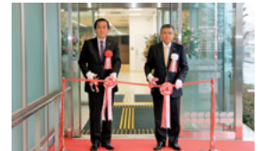
本郷谷健次松戸市長とのテープカット

柏の葉キャンパス支店は、平成28年6月の店舗移転にあわせて、当行の通常店舗としては初めてとなる個人のお客さまを対象とした平日の窓口営業時間延長と土日祝日の窓口営業を開始しました。平日15時以降と土日祝日は、資産運用や保障性商品・ローン等のご相談にお応えするほか、普通預金の口座開設や各種お届けの受付を行っております。