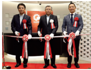
テープカットの様子

「恵比寿法人営業所」の業務を承継・拡大し、法人のお客さまだけでなく、個人のお客さまのローンや資産運用のご相談にも対応してまいります。