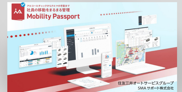
(モビリティ・パスポート)