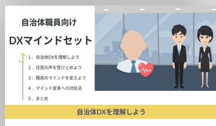
(株)デジタルグロースアカデミア