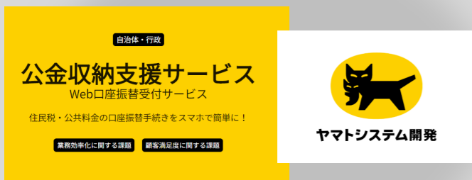
ヤマトシステム開発(株)