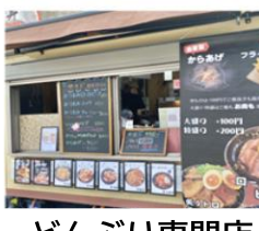
どんぶり専門店 丼ちゃん