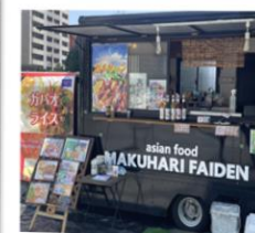
幕張ファイデーン