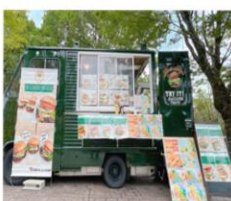
BELIEVER IN BURGER