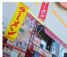
中国ラーメン 揚州商人