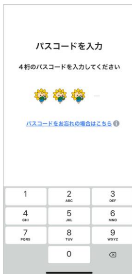
パスワード入力画面