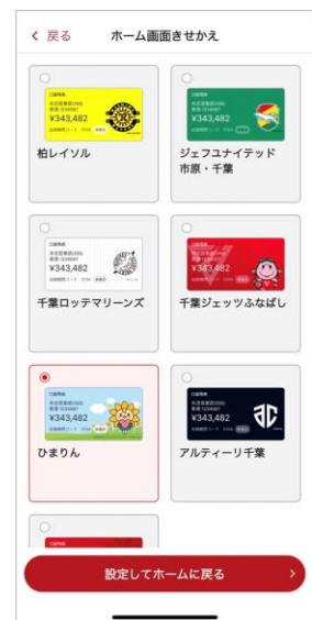
きせかえ選択画面