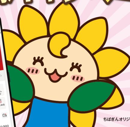
ちばぎんオリジナルキャラクター「ひまりん」