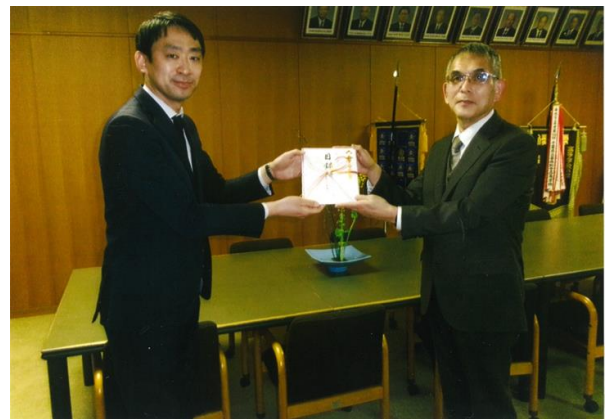
(左から順に) 山本副社長、横瀬校長