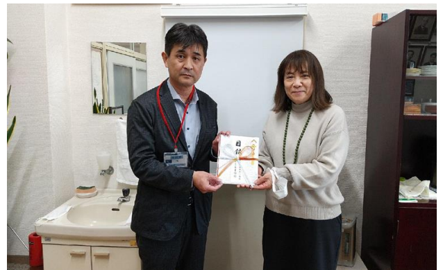
(左から順に) 須賀社長、渋谷校長