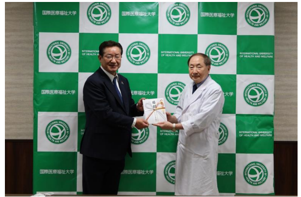
(左から順に) 阿久津社長、宮崎病院長