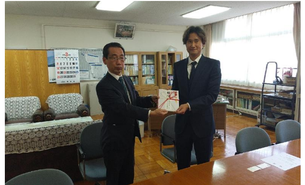
(左から順に) 常世田校長、柳田社長