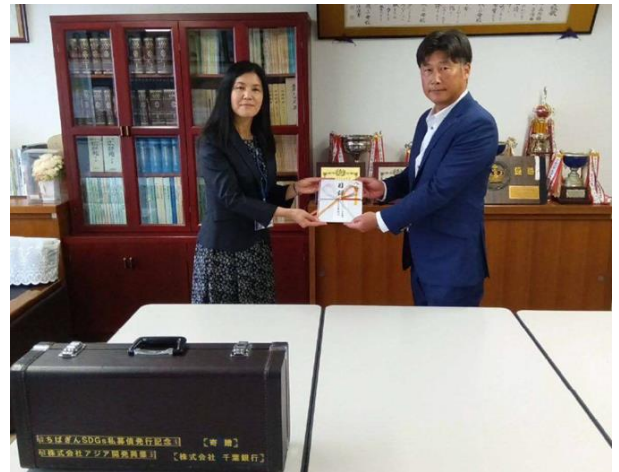
（左から順に）泉水校長、山田社長