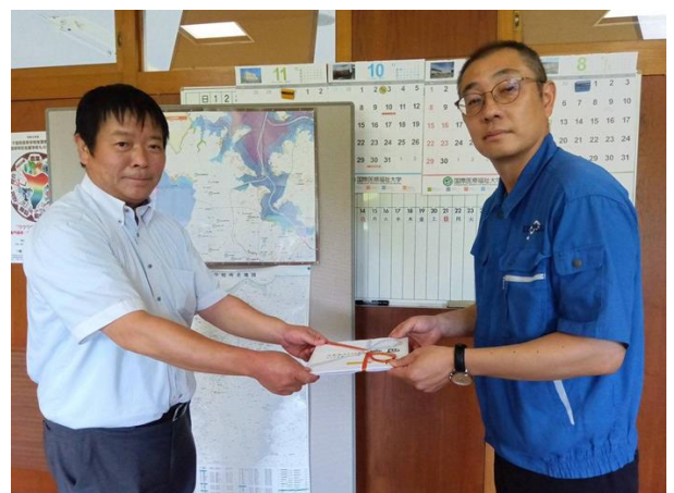
（左から順に）領家校長、竹内社長