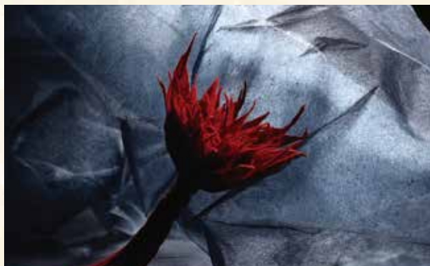
作品はすべて参考作品です。