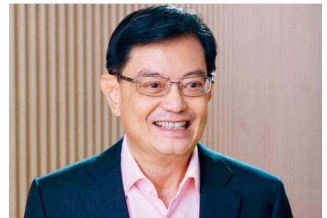
ヘン・スイキャット氏

2018 年、このチームが当時の財務大臣のヘン・スイキャット氏を全会一致でリーダーに選出したと発表しました。この発表を受け、同年 11 月に同氏は PAP で序列 2 位の書記長第 1 補佐に就き、2019 年 5 月には副首相兼財務相に任命されました。