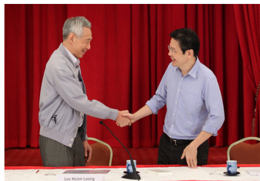
会見の様子（左：リー首相、右：ウォン氏）

リー首相は PAP 内の政治家からヒアリングを行い、ウォン氏の支持率が圧倒的に高かったことや、ウォン氏が財務相に加えて新型コロナウイルス対策チームの共同議長を務めており、その実績が評価されたことなどを選出の理由として挙げました。