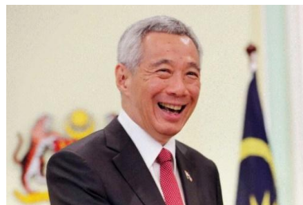
リー・シェンロン首相

2018 年 11 月、政権与党の人民行動党（The Peoples Action Party、以下 PAP）の若手政治家が集まるグループで協議の末、当時の財務相ヘン・スイキャット氏が次期首相候補として選出され、リー首相からの政権移譲に向けて準備が進むと見られていました。