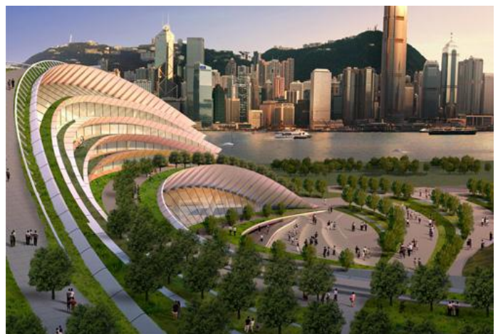
【西九龍駅完成イメージ】

中国本土の入り口である深セン市の福田駅～広州南駅区間(全長約 116 キロメートル)は 2015 年 12 月に開通し、すでに高速鉄道が運行しています。一方、香港区間は 2010 年に着工、当初の開通予定は同じく 2015 年でしたが、沿線住民による建設反対運動などを受け開通時期は度々順延されてきました。その後、2017 年 7 月時点で 95%まで工事が進捗し、2018 年第 3 四半期には香港区間が完成、全線が開通する見通しとなっています。